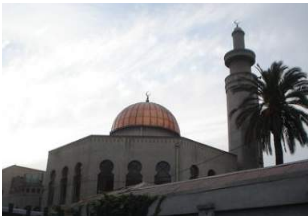
La mezquita de Dar as Salam en Santiago