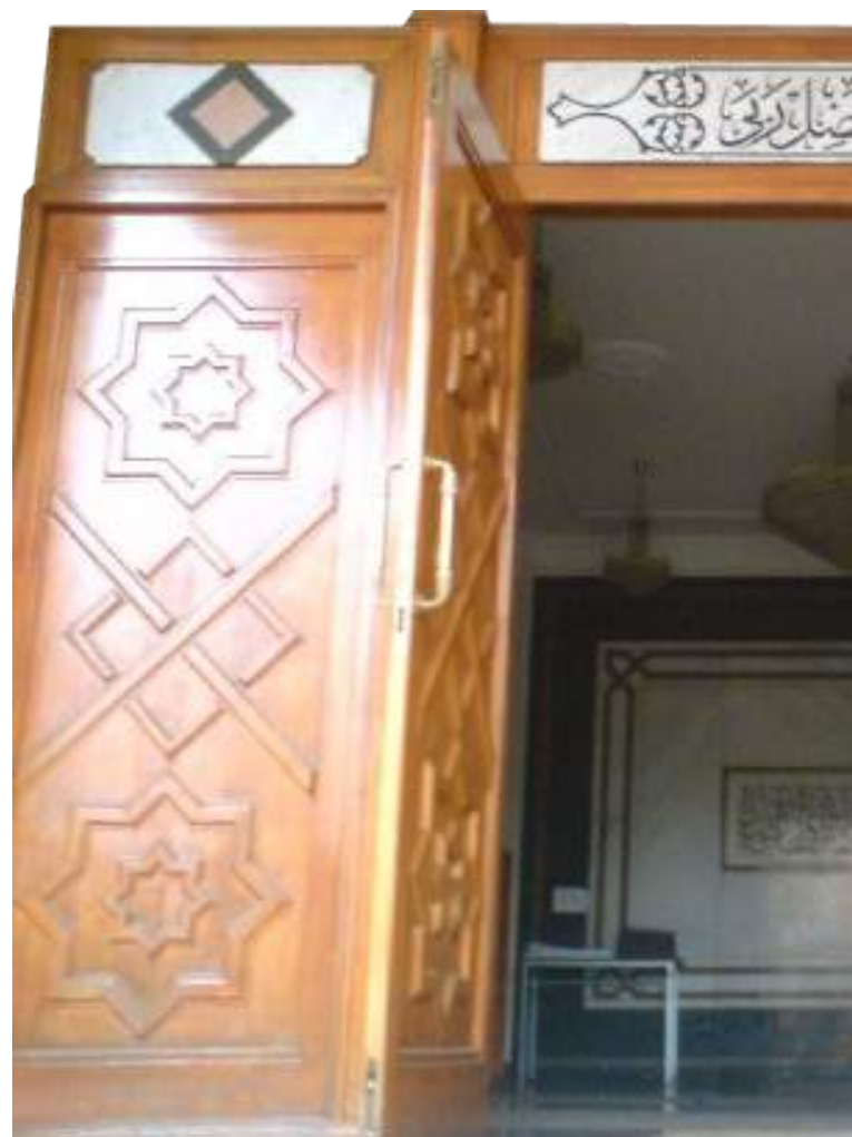
Entrada de la mezquita de Dar as Salam

Con un sentimiento de soledad, sabía que solo Dios, solo lo trascendente podría satisfacer este sentimiento de vacío. Volví a mi iglesia, la que por tanto tiempo fue el lugar de Dios para mí. Pero esta vez fue diferente, comencé a reflexionar seriamente en cuanto enseñaban. Me di cuenta con espanto de que se enseñaban cosas que Jesús, el personaje central de la fe, no había nunca enseñado. Comencé a reflexionar acerca de si él era realmente Dios o solo un hombre, si realmente su mensaje coincidía con lo que las personas decían y enseñaban. Así, comencé por mi cuenta a estudiar la biblia y eso aumento