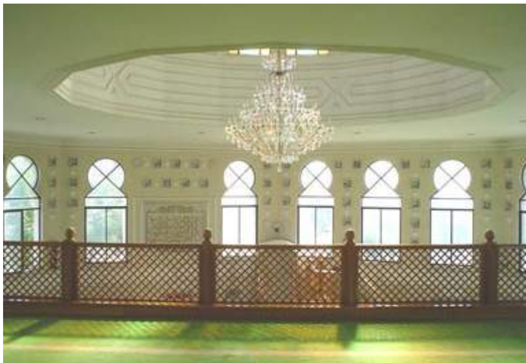
Interior de la mezquita de Dar as Salam en Santiago

ciegamente y siempre pidan pruebas de lo que se les enseña. El Islam puede ser lo mejor que les ha pasado en la vida, si están dispuestos a seguir la Sunnah y a pensar en la próxima vida en el paraíso y dejar las cosas de esta vida. Nunca dejar de aprender, y que el salat es lo más importante que nos diferencia de los incrédulos.